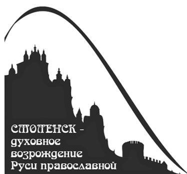
Рис. 2. Проект туристского бренда «Смоленск — духовное возрождение Руси православной» (автор — Е. Зубенко, г. Смоленск)