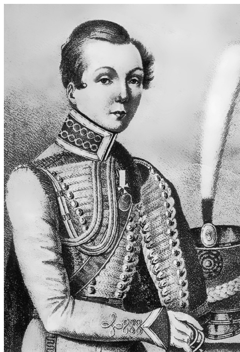
Н. А. Дурова [12]

Неординарная личность Надежды Дуровой является объектом неистощаемого интереса. Статьи о ней с завидной регулярностью публикуются на страницах научно-популярных изданий, журналов и газет [4; 5; 8; 9; 10; 11 и др.]. Справедливо-