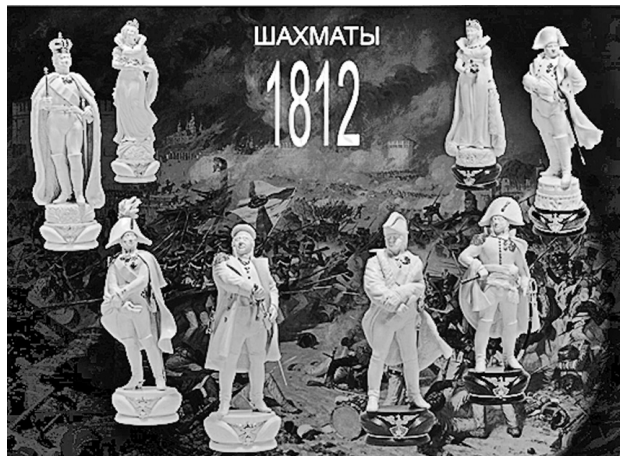
И. Эпштейн. Шахматы «1812 год». Бивень мамонта, серебро, золото, янтарь, самоцветы, кожа [7]

Современные создатели керамических изделий в стиле «майолика» также отражают события 1812 года в своих произведениях. В «Мастерской майолики Павловой и Шепелева» выпускают керамические фигуры солдат 1812 года.