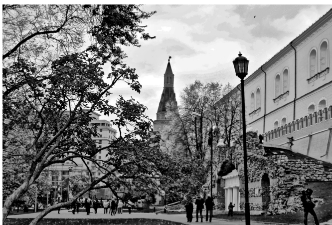
Прогулка по осеннему саду

ной красоты цветники и сохранившийся двухсотлетний дуб.