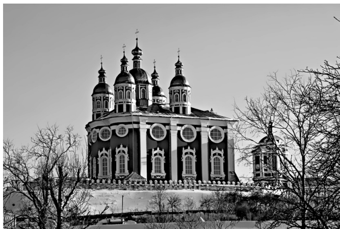
Свято-Успенский кафедральный собор

«Смоленск — щит России». Практически все туристы из Европы, посещающие Россию, проезжают через Смоленск. Много сотен лет назад здесь проходил торговый путь «из варяг в греки» — основная артерия славянских народов, которая связывала север с югом и пересекалась здесь с дорогами, ведущими с запада на восток. Смоленск со своей знаменитой крепостью был «ключом Московского государства», стражем России на ее западных рубежах. Нередко Смоленщину называют «Западными воротами в Москву». И свидетельством тому — сохранившиеся в городе до наших дней памятники воинской славы разных исторических периодов. Безуслов-