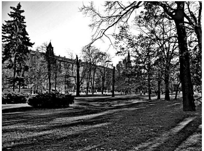
Старые деревья Александровского сада

Сад имеет три аллеи, идущие вдоль Кремля. Среди его украшений — голубые ели и сирень, акация и жасмин, удивитель-