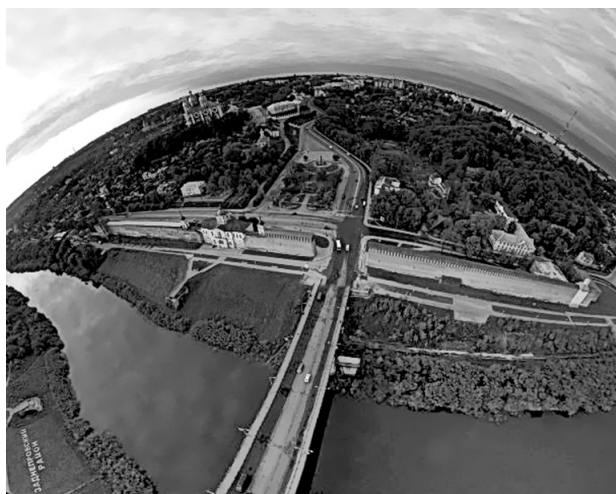
Панорама города Смоленска [5]

«Смоленск — духовное возрождение православной Руси». Символом города неофициально считается Свято-Успенский кафедральный собор, возведенный в 1772 году (рис. 3). Он был построен в память о героической обороне Смоленска в 1609–1611 годах на месте одноименного собора XII века. Его внутреннее убранство — резной иконостас и икона Смоленской Божьей Матери Одигитрии, которая является главным объектом паломничества на протяже-