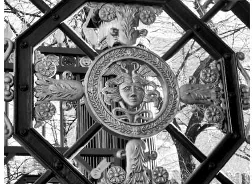
Чугунная решетка ворот Александровского сада

Александровский сад — одно из замечательных мест столицы. Расположенный в самом центре у стен Кремля, он протянулся от Красной площади до Кремлевской набережной. Сад был разбит по указу Александра II при восстановлении города после войны 1812 года. Назывался он в то время Кремлевским и строился с 1819 по 1822 гг. Раньше здесь протекала река Неглинная, а через нее от Троицкой башни до Кутафьей был раскинут мост, по которому можно было перейти из Верхнего сада в Средний. В 1856 году сады были названы Александровскими и состояли из трех частей. Верхние сады длиной 350 м идут от Угловой Арсенальной башни Кремля до Троицкого моста у Кутафьей башни. Средние, длиной 382 м, расположены от Троицкой до Боровицкой башни. Нижние имеют длину 132 м и выходят на Кремлевскую набережную. Очень многое в Александровском саду напоминает события 1812 года и, если, совершая прогулку, направиться в Александровский сад со стороны Кремлевского проезда и Исторического музея, то мы пройдем через величественные чугунные ворота Главного входа и попадем в Верхний сад, открывшийся в 1823 году. Чертеж чугунной решетки ворот с изображением символов победы в Отечественной войне выполнил архитектор Е. Паскаль.